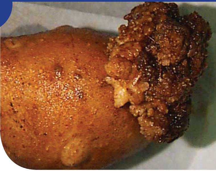
Patates Halka Çürüklüğü