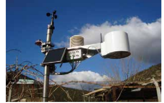
Tahmin uyarı sistemleri Entegre Mücadelede etkin olarak kullanılmaktadır.