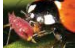
Doğal denge ve faydalı organizmalar korunur