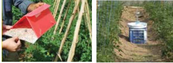
Domates Güvesi Tuzakları