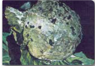
Doku üzerindeki siyah yapılar