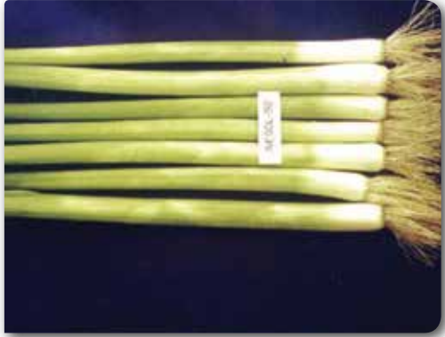
Inegöl 92 pırasa çeşidi bitkilerinin görünümü

Pırasa üretimi tarlaya direkt tohum ekimi ve fideden yetiştiricilik şeklinde yapılır. Ancak fide ile üretim en geçerli olan yetiştirme yöntemidir.