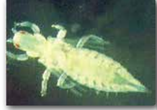
Yaprak galeri sineği ergini