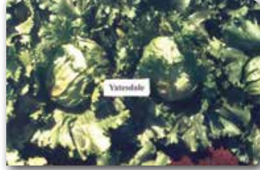
Kıvrık baş salata

3. Marullar: Romen tipi olarak bilinen bu gruptaki salatalar uzun yaprakların birbirini örtmesi ile gevşek ve dik somun şeklinde baş oluştururlar