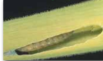
Pirasa güvesi'nin yaprak arasında beslenen larvası