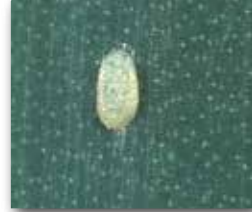
Pirasa güvesi yumurtası