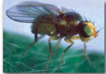
Yaprak galeri sineği ergini