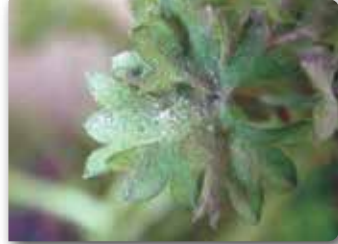
Külleme hastalığının yaprak üst yüzeyindeki belirtileri