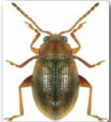
Epithrix hirtipennis ergini