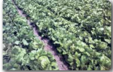
Salata üretim parselinin görünümü

Bütün yıl boyu pazarlarda bulma olanağımız olan ve sofralarımızda taze olarak kullanılan salatalar, serin iklim sebzesidir. Erken ilkbahar ve sonbaharda açık tarlada ve kış ürünü olarak da ısıtmasız örtü altında yetiştiriciliği yapılmaktadır. Yetiştirme periyodunun kısa olması nedeni ile arka arkaya birkaç ekim zamanı kullanılarak pazarda bu ürünün devamlılığı sağlanmaktadır.