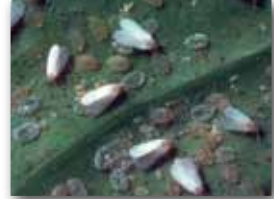
Beyazsinek ergin ve larvaları