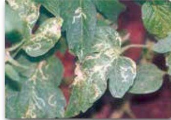
Yaprak galeri sineği ergini