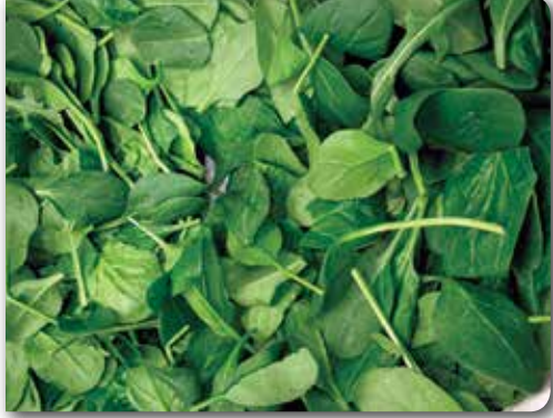
İspanak bitkilerinin genel görünümü

İspanak serin iklim sebzesidir. Sıcak ve kurağı sevmez. 15–20°C'lik sıcaklıklar idealdir. Bol ürün için yetiştirme dönemi iyi ayarlanmalıdır. Kışı sert geçen yerlerde, erken ekilen ıspanaklar, geç ekilenlere göre daha çok zarar görür.