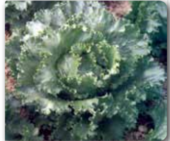
Kıvrıkcık yaprak salata çeşidi

1. Yaprak salatalar: Baş yapmayan, kıvrıkcık, gevşek ve toplu yapraklardan oluşan salatalardır.