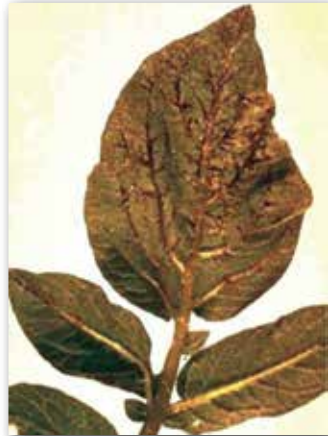
Etmenin yapraktaki belirtileri