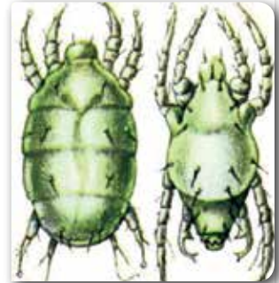
Sarı çay akarı erginleri