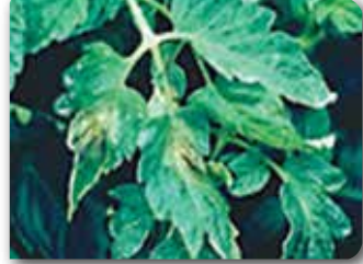
Mildiyöye ait yaprak lekeleri