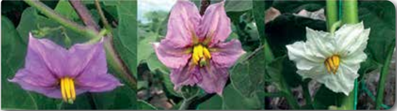
Resim 1. Farklı renklerde patlıcan çiçekleri.

Patlıcan, güçlü bitki yapısına sahiptir. Bitki 60-120 cm boylanabilir. Örtüaltı şartlarında boy daha fazla uzamaktadır. Kök sistemi güçlüdür. Yapraklar büyük ve kenarları dalgalıdır. Çiçekler mor, açık mor ve beyaz renklerde olabilir (Resim 1). Çiçekler yaprak koltuklarında meydana gelir. Bir boğumda 2-4 çiçek tomurcuğuna rastlanır. Yaprak, gövde ve çanak yapraklarda diken bulunabilir. Meyve şekli silindirik ve oval arasında değişir. Meyve rengi parlak koyu mor, beyaz, yeşil, sarımsı veya çizgili olabilir (Resim 2). Ülkemizde yaygın olarak siyah renkli, uzun silindirik tipte meyveleri olan patlıcanlar tüketilmektedir.