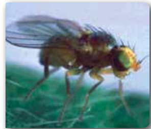
Yaprak galeri sineği ergini