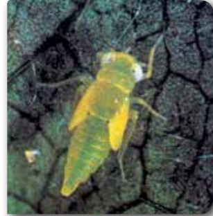
Yaprak piresi nimfi