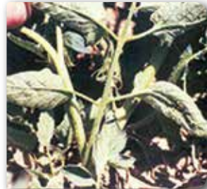
Domateste yaprakbiti zararı