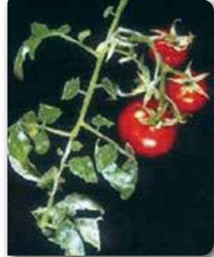
Domateste külleme zararı

Kimyasal Mücadelede Kullanılacak İlaçlar ve Dozları: İl/ilçe Müdürlükleri ve reçete yazma yetkisi bulunan kişilerce belirlenmelidir.