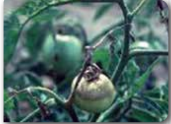
Gövde ve meyvede ortaya çıkan zarar