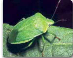
Piskokulu yeşilböcek ergini