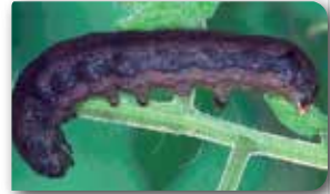
Pamuk yaprakkurdu larvası