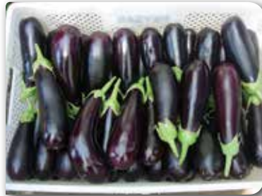
Resim 11. Kasalara yerleştirilmiş meyveler.