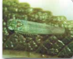
Yaprak piresi ergini