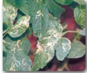
Yaprak galeri sineği ergini