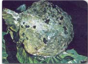
Doku üzerindeki siyah yapılar