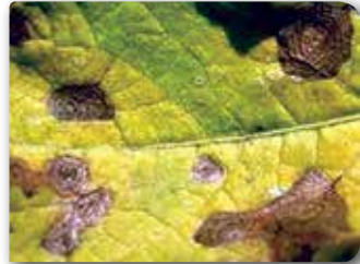
Yapraktaki iç içe halka şeklindeki belirtiler.