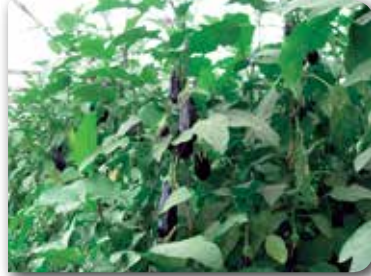
Resim 10. Hasat olgunluğuna gelmiş meyveler.