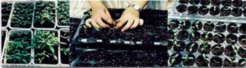
Resim 3. Genç bitkilerin viyollere şaşırtılması.

Patlıcan tohumunu çimlendirme sıcaklığı 24-30°C'dir. Hızlı ve homojen bir çimlenme için sıcaklık gece 20°C, gündüz 28°C ise civarında olmalıdır. Çimlendirme plastik çimlendirme kaplarında, kasalarda veya yastıklarda yapılabilir. Çimlendirme ortamı olarak kullanılacak torfun kalitesi çok önemlidir. Kullanılacak torf daha önce yetiştirme amaçlı kullanılmamış olmalı veya iyi bir şekilde dezenfekte edilmiş olmalıdır. Tohumlar gereğinden fazla, sık ve derin ekilmemelidir. Tohum ekildikten sonra üzeri şeffaf plastik örtü ile küçük bir tünel yapılarak kapatılır ve çimlenme görüldüğü zaman bu örtü kaldırılır. Çimlenmeden sonra genç fidecikler iyi özellikteki verimli topraklara şaşırtılır (Resim 3). Bitkilerin kök sisteminin daha iyi gelişmesi için bitkicikler ayrı hücreler içeren viyollere veya ayrı kaplara şaşırtılmalıdır. Bu dönemde fazla sulamadan kaçınılmalı, gereksiz yere fazla azotlu gübre verilmemelidir. Aksi takdirde hastalık problemleri ortaya çıkabilir. Ani sıcaklık değişimleri de bitki gelişimini olumsuz yönde etkileyeceğinden tohum erken ekim yapılmalıdır. Tohum ekim tarihini belirleyebilmek için, öncelikle tohum ekiminden fidenin dikim aşamasına kadar geçen süre dikkate alınmalı, bu süre fidelerin araziye dikim tarihinin önüne eklenmelidir. En iyi teknik,