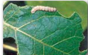
Pamuk yaprakkurdu zarar