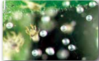
Kırmızıörümceklerin ördükleri ağlar arasına bırakılan yumurtaları