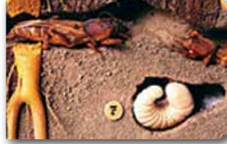
Danaburnu ergini, larvası ve zarar şekli