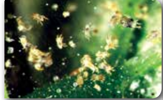
Ördükleri ağlar arasında beslenen Kırmızıörümcek popülasyonu