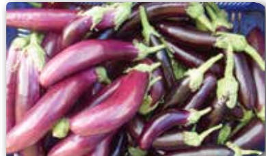
Resim 2. Farklı renk ve tiplerde patlıcan meyveleri.