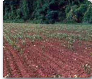
Telkurdu'nun tarladaki zararı