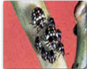
Piskokulu yeşilböcek nimfi