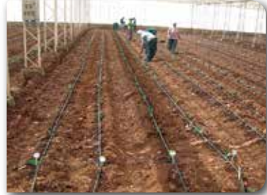
Resim 4. Dikim aşamasına gelmiş fidelerin dikimi.

lirtilen aralıklarda açılan çukurlara bitkinin kök boğazı toprak seviyesinde kalacak şekilde yapılır. Sonra köklerin etrafı toprak bastırılarak sıkıştırılır ve hemen arkasından can suyu verilir.