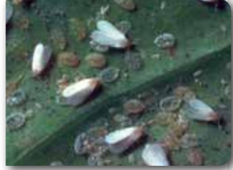
Beyazsinek ergin ve larvaları