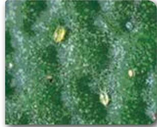
Yaprakta beslenen Sarı çay akarı