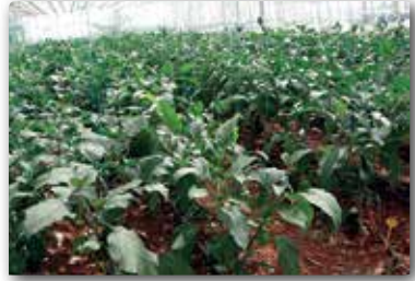
Resim 8. Budama yapılmış bitkiler.

Meyve tutumu: Patlıcan çiçekleri erdişi olduğu için gerekli iklim istekleri ve uygun yetiştirme teknikleri kullanıldığı takdirde meyve tutumunda problemle karşılaşılmamaktadır. Sıcak iklim bitkisi olan patlıcanın örtüaltı yetiştiriciliğinde gece sıcaklıklarının 16°C'nin altına düşmesi ve ışıklandırmanın şiddetinin azalması patlıcanda çiçek tozu mikar ve canlılığını azaltır. Bu dönemde dölllenme sekteye uğradığı için açan çiçeklerin % 70'e yakını dökülmekte, bu durum üreticilere ürün kaybı olarak yansımaktadır. Meyve tutumunu teşvik etmek için son dönemlere kadar bitki büyüme düzenleyicileri kullanılmakta idi. Ancak, insan sağlığı üzerindeki olumsuz etkileri sebebiyle birçok ülkede olduğu gibi, ülkemizde de bu kimyasalların meyve tutumunda kullanılması yasaklanmıştır. Bunun yerine, örtüaltı yetiştiriciliğinde söz konusu kritik dönemlerde meyve tutumunu teşvik etmek amacıyla bambus arısı kullanımı yaygınlaşmıştır (Resim 9).