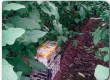
Resim 9. Bambus arısı.